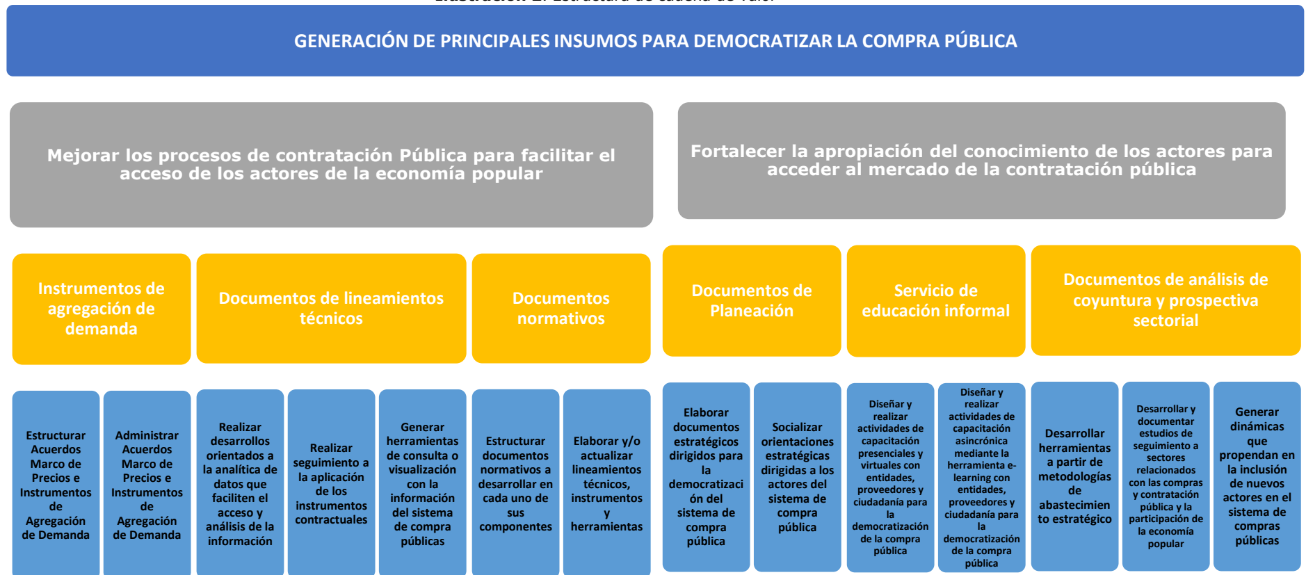
Ilustración 2. Estructura de cadena de valor