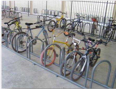
Imagen 1 Condiciones de cicloestacionamiento

La configuración de entrada y salida debe optimizar el espacio asignado para la mayor cantidad de bicicletas estacionadas.