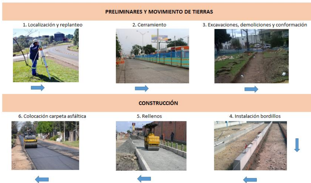
Ilustración 1 Proceso constructivo

A continuación, se presenta un diagrama el proceso constructivo básico de construcción teniendo en cuenta que los proyectos podrán complementar estas actividades de acuerdo con las condiciones particulares de cada municipio.