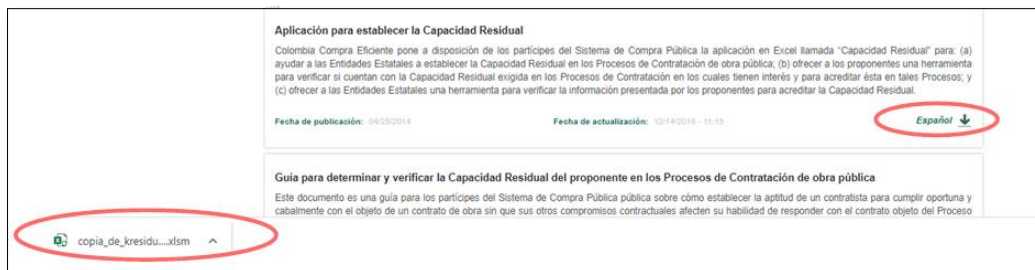
Imagen 2. Botón de descarga de la aplicación para establecer la Capacidad Residual

Nota: Una vez se realiza la descarga del archivo, es importante verificar que se encuentre desbloqueado para macros.