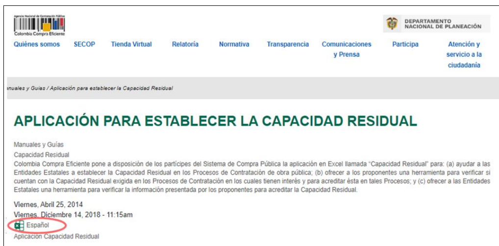
Imagen 3. Enlace para descargar la aplicación

Al abrir la aplicación en la hoja de "Inicio", se muestra el menú principal del cual se desprenden los formularios relacionados con la información del Proceso de Contratación y del Proponente (Imagen 4):