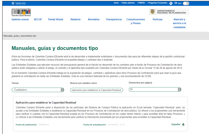
Imagen 1. Página web de la ANCP - CCE

Al hacer clic en “Español”, el sistema descargará la aplicación para establecer la Capacidad Residual ( Imagen 2 ). Esta consulta es la misma que se puede realizar a través de del siguiente enlace ( Imagen 3 ): https://www.colombiacompra.gov.co/manuales-guias-y-pleigos-tipo/manuales-y-guias/aplicacion-para-establecer-la-capacidad-residual