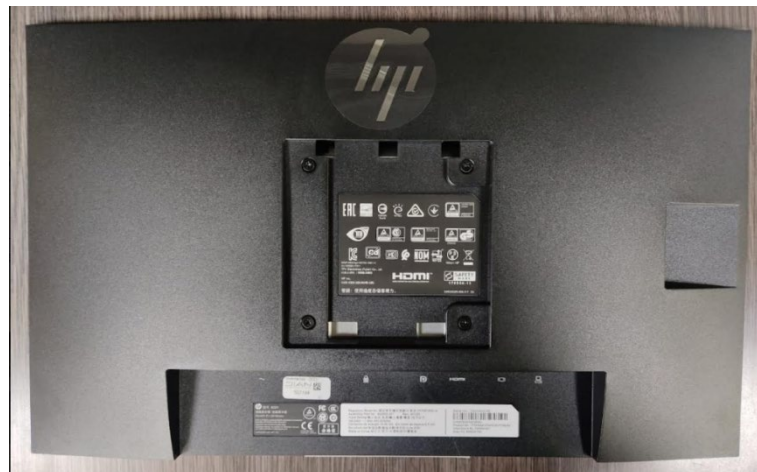
foto de la parte Trasera donde se vea la etiqueta del fabricante con los datos del monitor