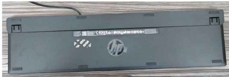
foto de la parte Trasera donde se vea la etiqueta del fabricante con los datos del teclado

Foto de la parte Trasera donde se vean las 4 esquinas como se observa en la siguiente imagen