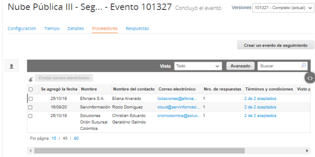
Imagen de proveedores del evento de cotización de la T.V.E.C.

Para determinar el valor del presente proceso, se lanzó el evento de cotización No. #101327, bajo las condiciones que establece el acuerdo marco en la Tienda Virtual del Estado Colombiano – TVEC, con un tiempo de cotización de 10 días hábiles, desde el día 01/02/2021 hasta el 15/02/2021 a las 5:00pm, bajo el “Acuerdo Marco de precios de servicios de Nube Pública III No CCENEG-015-1-2019”, recibándose tres (3) respuestas de cotización: