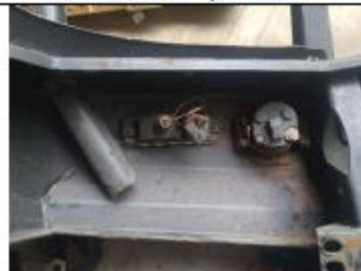
COMPARACIÓN: Construcción en lamina plegada, con poca soldadura; solo en unión de planos. Defensa marca TJM importada por iguana 4x4, procedencia Australia