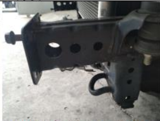
Punta de chasis derecha. Solo sujetan la defensa los dos tornillos frontales. Los que se pongan en los agujeros laterales quedan en el aire.