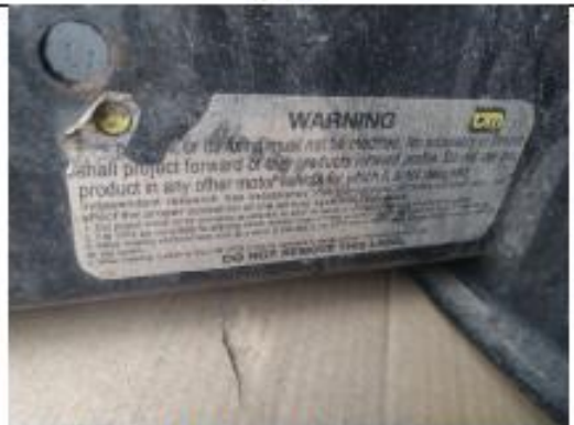
COMPARACIÓN: Etiqueta de conformidad funcionamiento Airbags. Defensa marca TJM importada por iguana 4x4, procedencia Australia