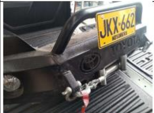
Puntos de anclaje de grilletes soldados solo a piel exterior de la defensa y grilletes sin certificación.