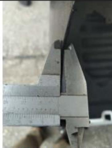
Lamina HR 2mm piel exterior