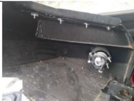
Soldaduras con abultamiento en lamina 2mm que conforma piel exterior. Construcción con piezas lisas (sin pliegues) soldadas