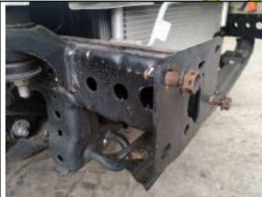
Punta de chasis derecha. Solo sujetan la defensa los dos tornillos frontales. Los que se pongan en los agujeros laterales quedan en el aire.