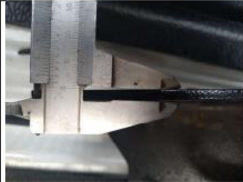
Lamina HR 4.5mm soporte winch