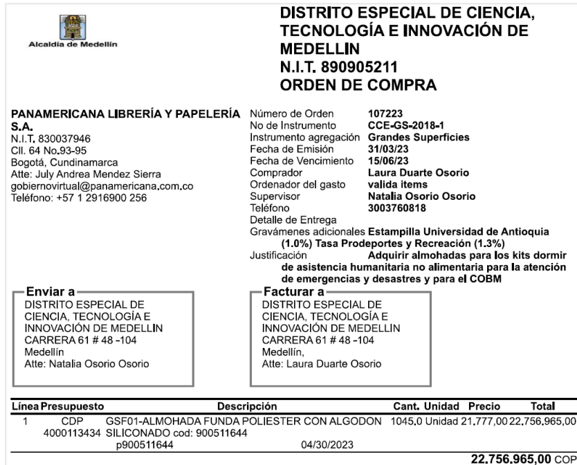
Imagen 1. Orden de compra inicial 107223 – Grandes Superficies

Los artículos fueron recibidos en las bodegas ubicadas en la Estación de Bomberos Libertadores el día 26 de abril de 2023.