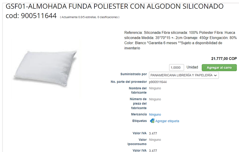
Imagen 2. Almohada funda poliéster con algodón siliconado publicada en TVEC

Los artículos recibidos cumplen con las especificaciones publicadas en la Tienda Virtual del Estado Colombiano – Grandes Superficies.