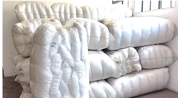
Imagen 4. Almohadas recibidas en las bodegas de la Estación de Bomberos Libertadores