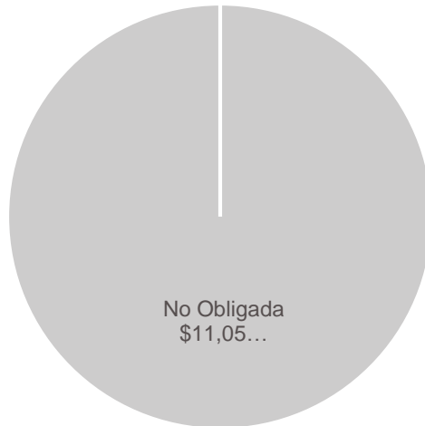
Gráfica 2 Resultados por grupo de Entidad Compradora (valores en millones de pesos)