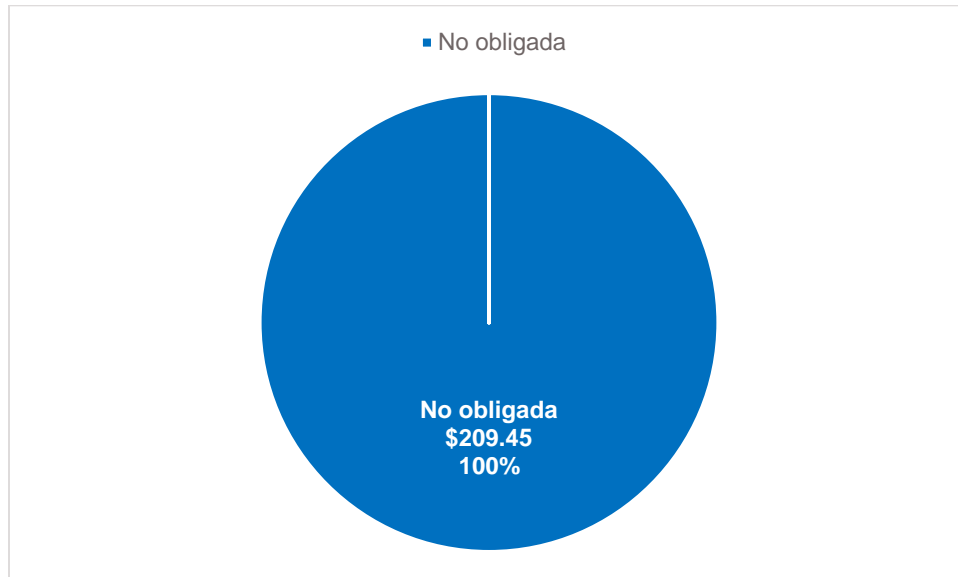
Gráfica 2 Resultados por grupo de Entidad Compradora (valores en millones de pesos)