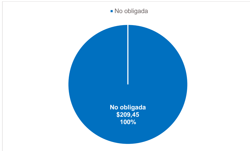
Gráfica 2 Resultados por grupo de Entidad Compradora (valores en millones de pesos)