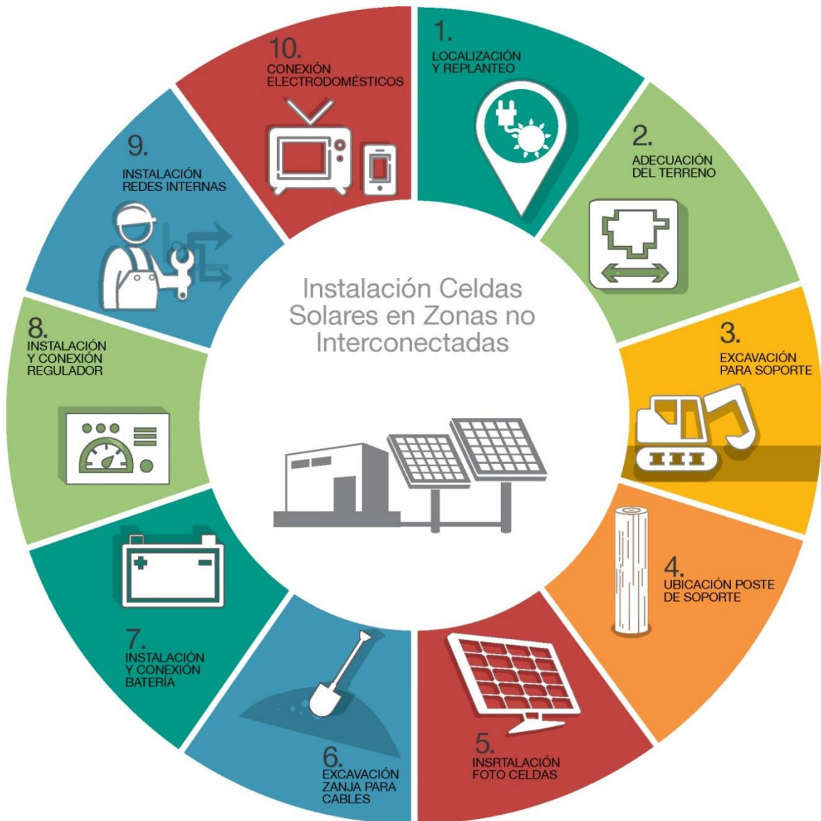
Ilustración 1 Proceso constructivo